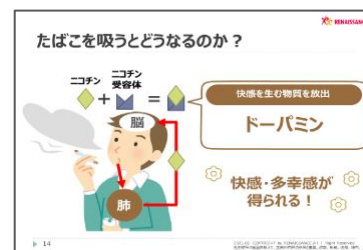
投影資料一部をご紹介

セミナーでは、喫煙をめぐる世の中の動き、たばこの依存性、喫煙・受動喫煙による健康影響、禁煙を始めるにあたっての問題解決やヒントについて説明します。また、加熱式たばこの健康影響や三次喫煙についても取り扱っています。