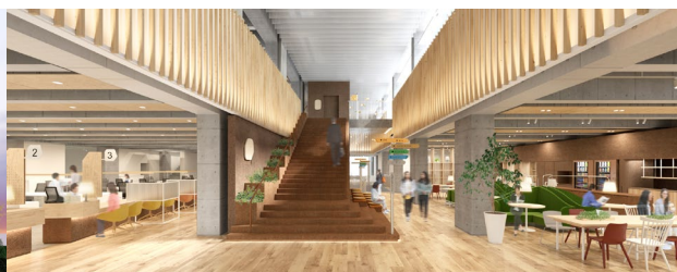
カルビーポテトチップス発祥の地でもある小清水町 | 新庁舎とにぎわいエリアをつなぐ空間「じゃがいもストリート」