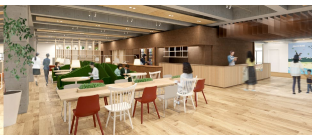
にぎわいエリア | コミュニティスペース、カフェ