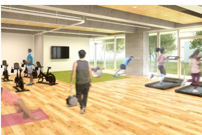
ルネサンス監修 にぎわいエリア | フィットネスジム&スタジオ