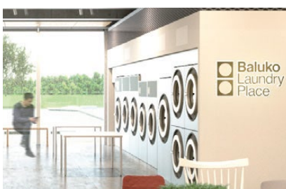
OKULAB監修 にぎわいエリア | ランドリー