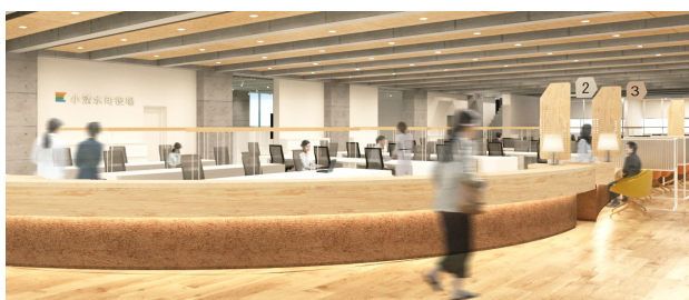
小清水町役場 | 町民サービスカウンター