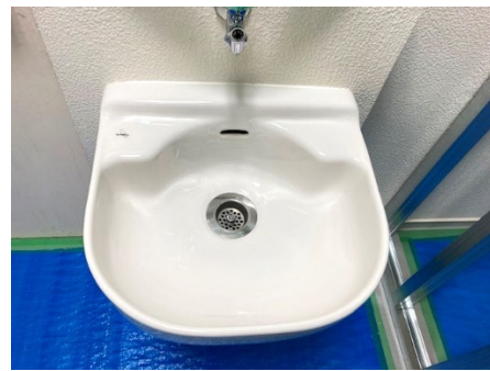
事例1 館内の洗面ボウルコーティング施工