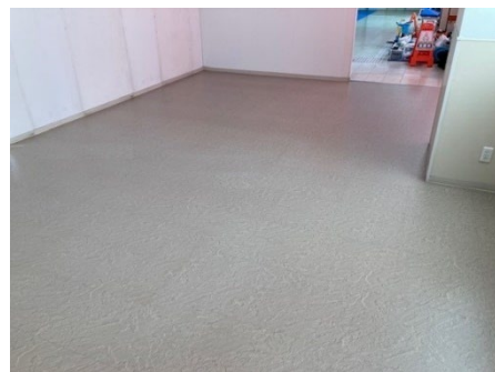
事例2 階段横床面 剥離洗浄+ワックス塗布