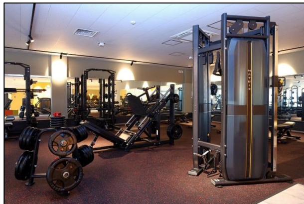
トレーニングジム