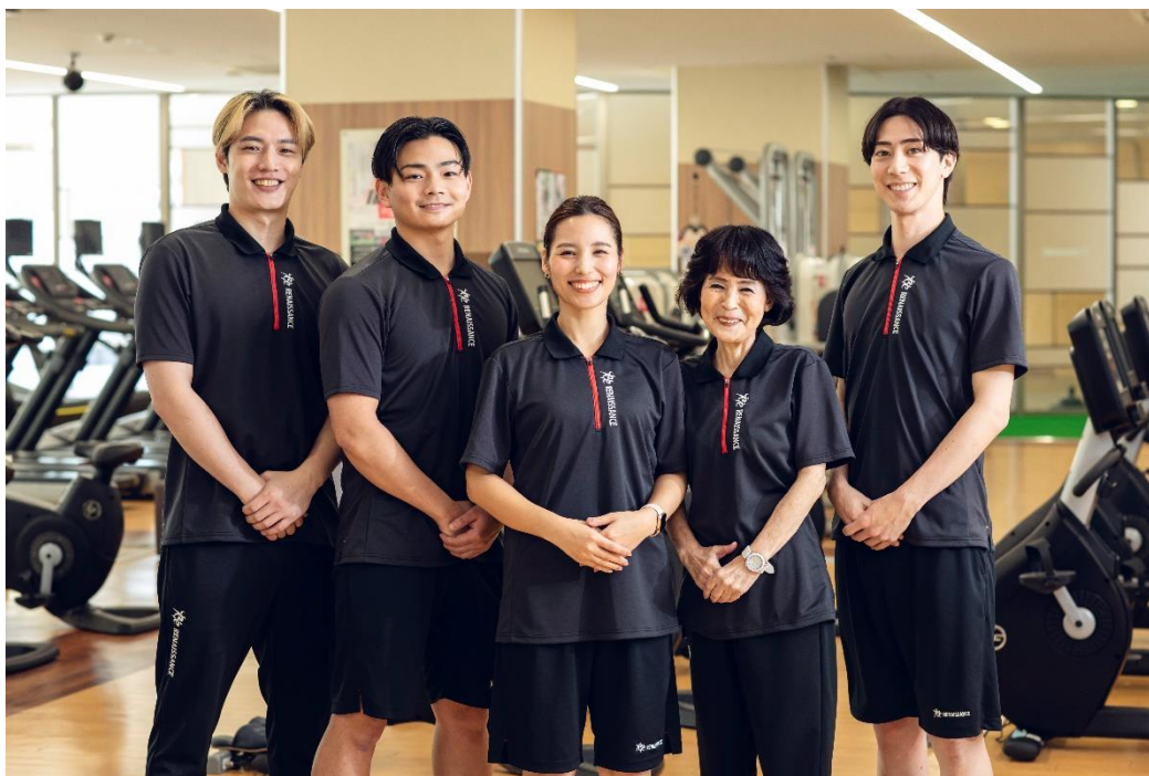
2025年4月1日より着用の新ユニフォーム

長期ビジョンである「人生100年時代を豊かにする健康のソリューションカンパニー」を目指し、引き続き社会と皆様の健康づくりの支援に取り組んでまいります。