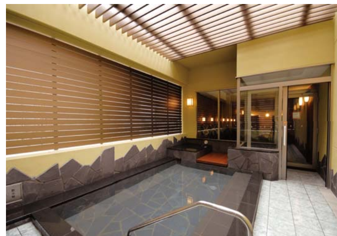
曳舟クラブ 露天風呂