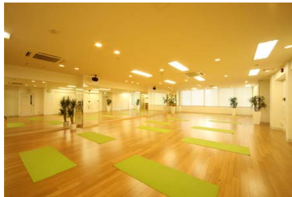
Demi RENAISSANCE 五反田・スタジオ

「Demi RENAISSANCE」のメインコンセプトは「素足の感触」。都会にしながら「靴を脱ぐ」という解放感を満喫できる、新しいタイプのスタジオです。ヨガやピラティスのほか、ベリーダンスやフラダンスなど、流行に敏感な女性のニーズに応えた多彩なプログラムを提供しております。主に 20～30 歳代の働く女性のお客様を中心に多くのご支持をいただいております。