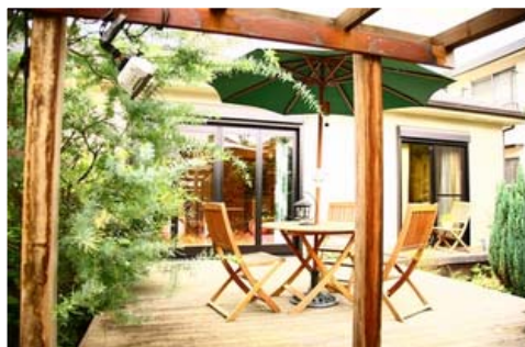
プラナガーデン吉祥寺・外観