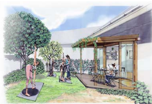
「庭とウッドデッキ」