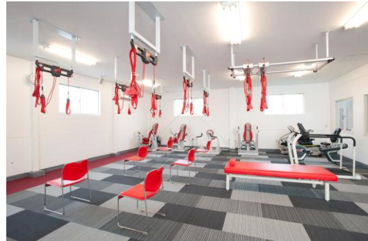
「ルネサンス 元気ジム 港南台」