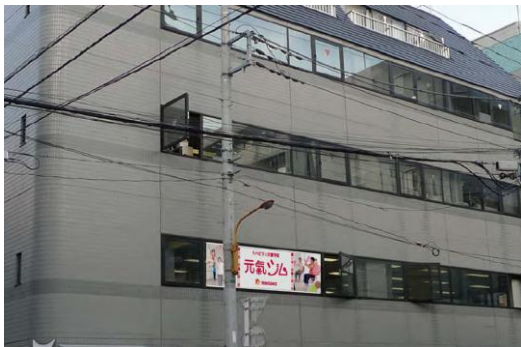
「ルネサンス 元気ジム 両国」