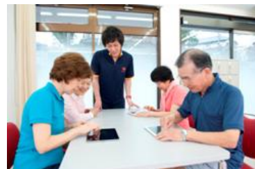
iPadを使った コミュニケーション