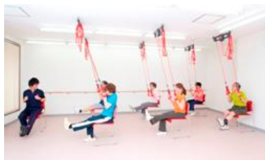
レッドコード・トレーニング