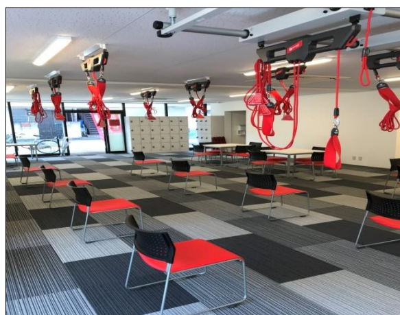
「ルネサンス 元氣ジム練馬」外観・室内