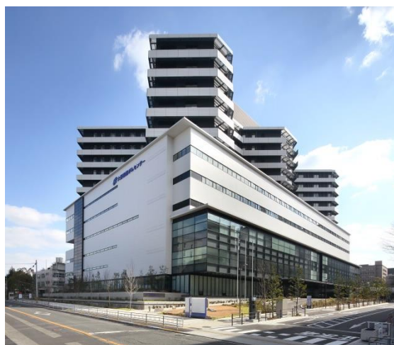
大阪国際がんセンター外観