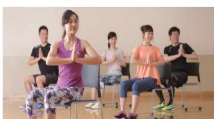
心とカラダのリフレッシュ