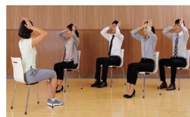
パソコン作業の疲労回復

その他ストレッチや骨格調整のプログラムなど、企業の健康課題を解決するプログラムを多数ご用意しております。