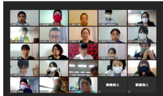
オンラインワークショップの様子

今後も、ダイバーシティ&インクルージョンの推進を通じて、一人ひとりが生きがいをもって働き続けられる会社を目指してまいります。