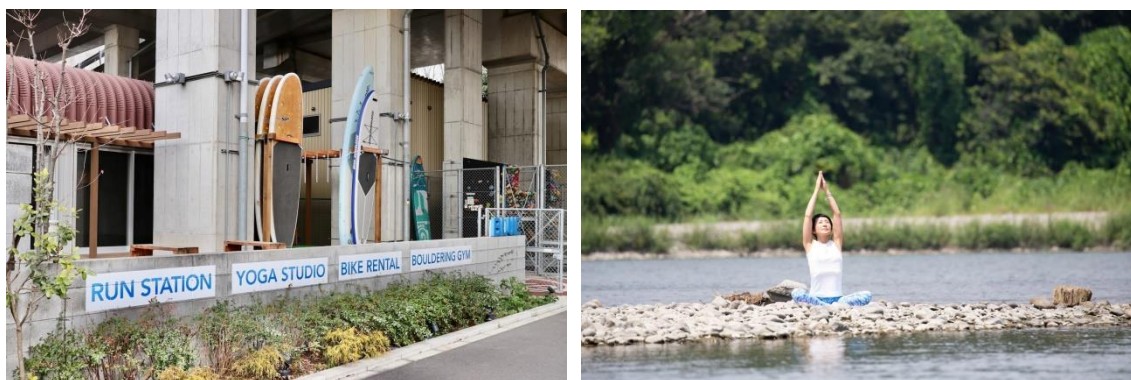
BLUE 多摩川アウトドアフィットネスクラブ