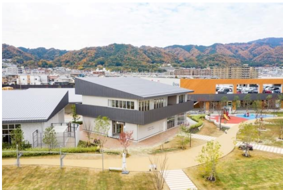
コミュニティパーク大津京