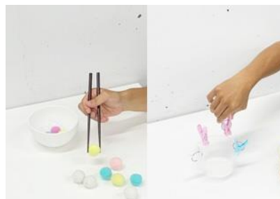
【課題志向型アプローチ】