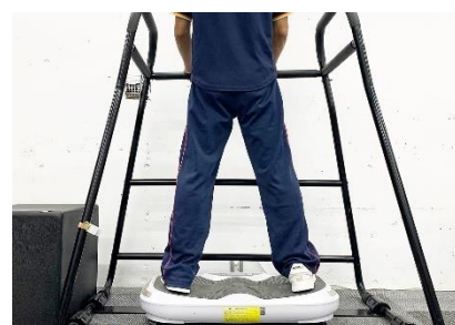
【荷重感覚とリズムの入力装置】